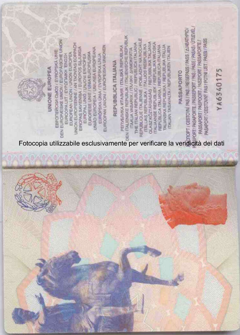
Fotocopia utilizzabile esclusivamente per verificare la veridicità dei dati